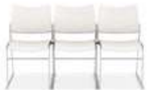
Koppeling zonder armleggers Verkettung ohne Armlehnen Linking without armrests Assemblage sans accoudoirs