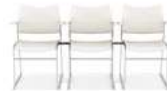
Koppeling met armleggers Verkettung mit Armlehnen Linking with armrests Assemblage avec accoudoirs