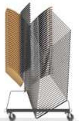
32 x Curvy

NL Curvy's thuisbasis is zijn transportwagen. Hoe eenvoudig hij daar in schuift! Hoe weinig ruimte hij in beslag neemt! 45 stoelen kunnen opgeborgen worden op slechts 0,6 m 2 . Een volledige stapel van 45 stuks kan zelfs nog door een deuropening worden gereden. Heeft de stoel armleggers of is hij gestoffeerd dan worden er nog altijd 32 stoelen gestapeld op een transportwagen en dat is veelal meer dan voldoende.