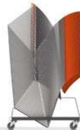
45 x Curvy

43, 44, 45 ... past! ... passt! ... they fit! ... le compte est bon !