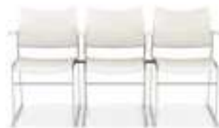
Koppeling met/zonder armleggers Verkettung mit/ohne Armlehnen Linking with/without armrests Assemblage avec/sans accoudoirs